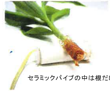
セラミックパイプの中は根だけ

セラハイトは世界で初めての本格的な室内用植物商品です 日本発・世界18カ国特許取得済み セラハイト45シリーズは世界統一標準のサイズです